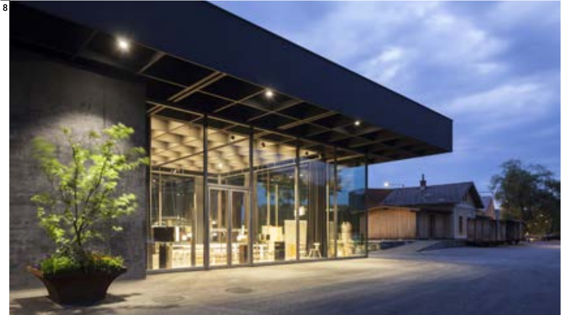
Abb. 8 Werkraumhaus Andelsbuch, 2013 – kooperatives Manifest der Handwerkskultur, nach dem Kunsthaus Bregenz, 1997, Peter Zumthors zweites Leuchtturmprojekt in Vorarlberg.