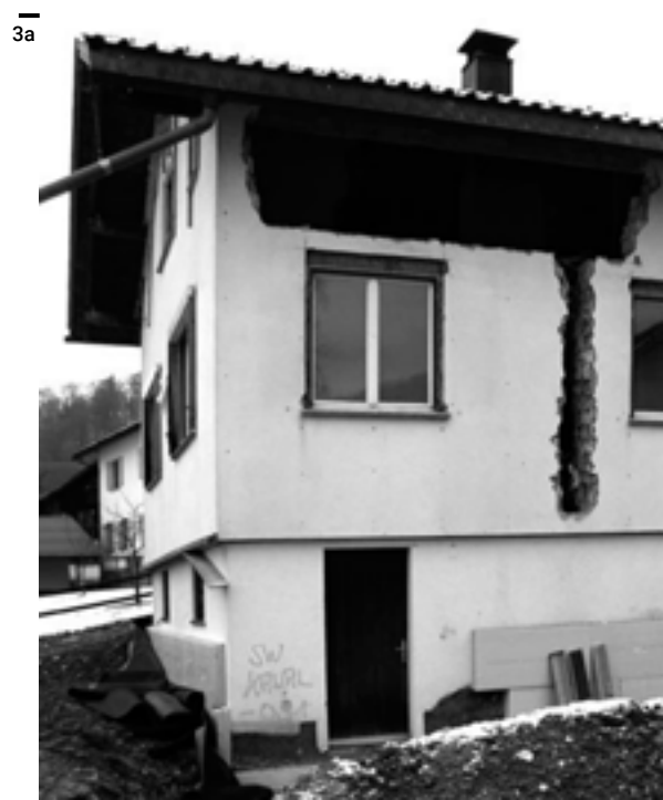
Abb. 3a, b Die Ertüchtigung und Nachverdichtung von Einfamilienhäusern wird hoch gefördert: Beim Umbau von Haus S. in Egg wurde mit Stroh gedämmt. Arch. Georg Bechter, 2011.

Die Rahmenbedingungen für die Architekturproduktion haben sich deutlich verändert. Noch nie zuvor waren Daten und Fakten so leicht kommunizierbar wie heute. Das Generieren und der Austausch von Wissen sind auf Knopfdruck möglich. Das gilt für das Abrufen von Standards, das Abgleichen von Vorstellungen, die Einsicht in übergeordnete Planungen genauso wie für die Entwicklung